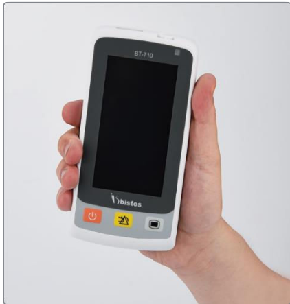
Tamaño de mano