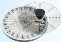
Rotor de hematocrito con tapa con disco de evaluación incluido.