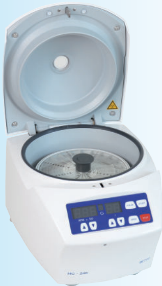
CENTRÍFUGA DE HEMATOCRITO HC-240 BOECO