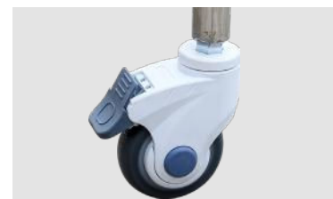
Cuna acrílica para bebé